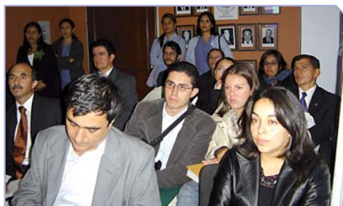
Asistentes reunión Capítulo Columna

Tema: Discusión de casos clínicos Fecha: 1 de Noviembre de 2007 Lugar: Sede SCCOT Patrocinador: Synthes