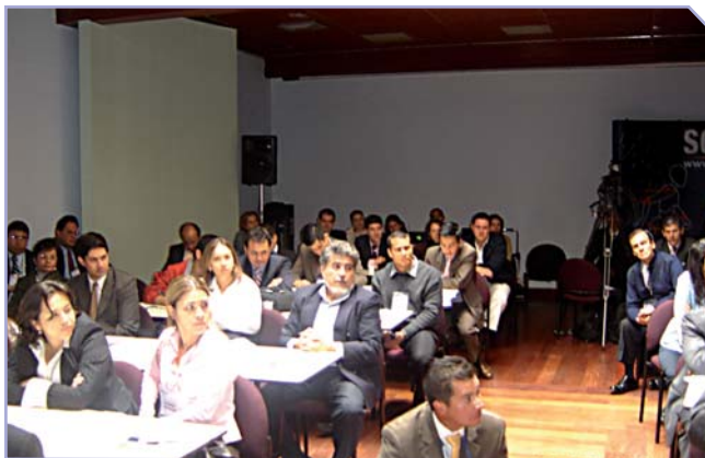
Asistentes I Curso de Tumores Musculo-esqueléticos Dr. Diego Soto Jiménez

En el Auditorio del Edificio El Bosque en la ciudad de Bogotá se realizó el I Curso de Tumores Musculo-esqueléticos Dr. Diego Soto con el apoyo del Capítulo de Tumores Óseos y Enfermedades Metabólicas, durante los días 16 y 17 de Noviembre de 2007. Agradecemos la participación de los Conferencistas Nacionales invitados quienes con su experiencia y conocimiento científico y académico hicieron del evento un éxito, contando con significativa asistencia de especialistas nacionales e internacionales.