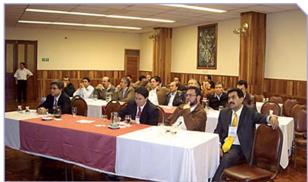
Asistentes Curso Regional Encuentro Colombo – Ecuatoriano

A continuación presentamos los conferencistas: