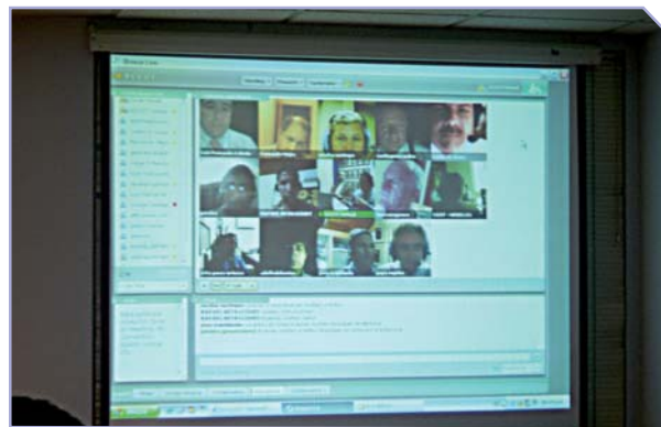
Asistencia virtual Delegados Nacionales.