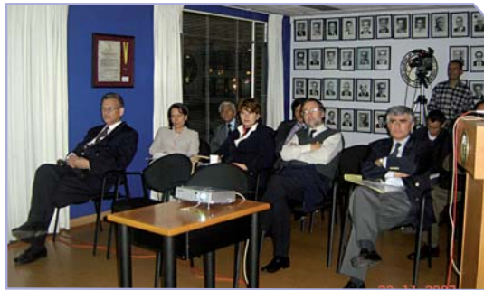
Asistentes reunión Capítulo Ortopedia Infantil