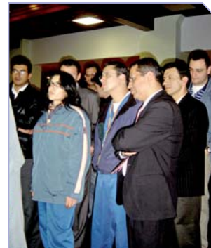
Exposición de casos clínicos