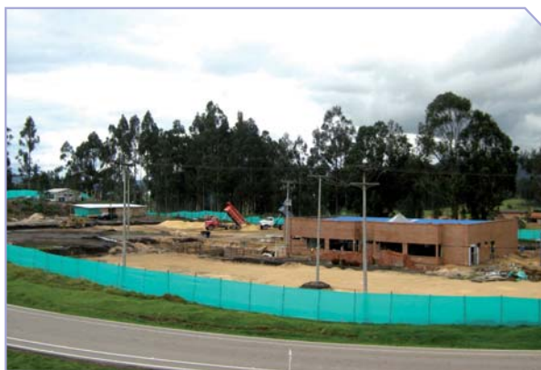
Avance Construcción CLEMI

"show rooms"; de alojamiento y hospedaje con salas de lectura y de entrenamiento en modelos secos y virtuales y la zona donde esperamos que vaya a quedar la nueva sede de la SCCOT.