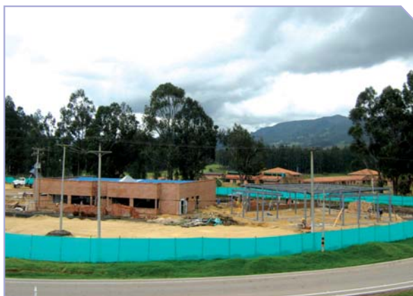
Avance Construcción CLEMI

Finalmente, la tercera etapa será el "Centro Empresarial – Hotelero" con áreas de restaurante, de atención empresarial con los llamados