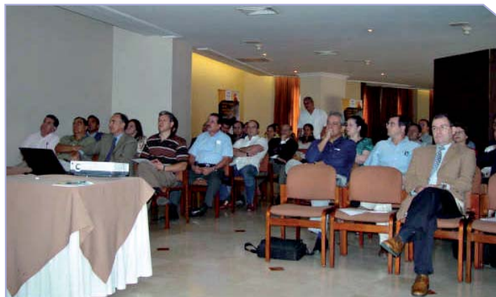
Asistentes reunión capítulo de Cadera y Rodilla en Cali