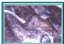
Fig. 2. En la disección se observa cómo al anudar primero el Surgidac, se logra una reducción anatómica en el sentido horizontal en la articulación acromioclavicular.

Al anudar estas suturas primero se logra una reducción casi anatómica de la clavícula en el sentido anteroposterior (figura 2). Inmediatamente se anuda el Cervix Set® (figura 3) y se repiten las mediciones de igual forma que en los casos anteriores.