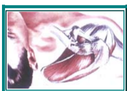
Fig. 3A. En el esquema se aprecia la reducción anatómica de la articulación acromioclavicular y la fijación definitiva con el Surgidac además de la doble lazada con el Cervix Set®.

El punto de falla con todos los sistemas fue considerado como el peso en el cual se producía la ruptura del material.