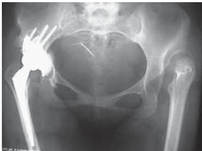
Figura 22. Control POP con el anillo reorientado.

Otro caso de complicación, se produjo en el postoperatorio tardío en el tercer control radiológico al segundo mes, se detectó el aflojamiento del material de Osteosíntesis de la osteotomía, se recolocó el implante, asociándole injertos y otra placa, con lo cual la osteotomía consolidó (figura 22).