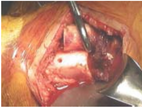
Figura 7. Medida de la diafisectomía de acortamiento