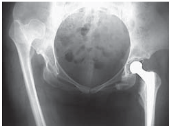
Figura 10. Control POP primera cadera

Los controles radiológicos son mostrados a continuación: