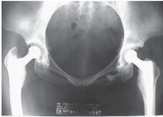
Figura 11. Control POP de las 2 caderas