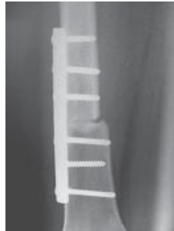
Figura 14. Consolidación a los dos meses POP