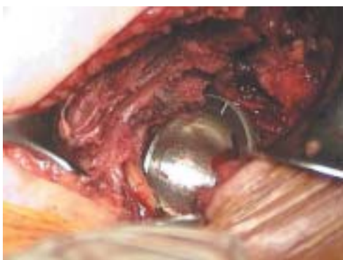
Figura 1. Copa en acetábulo original