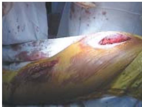
Figura 4. Doble incisión