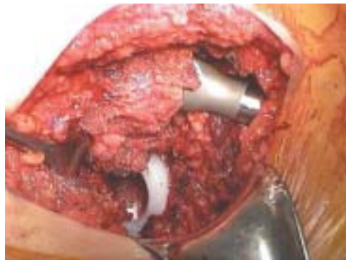
Figura 3. Diferencia altura en componentes