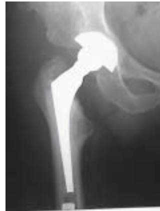
Figura 20. Revisión acetabular al acetábulo original

Ocho meses después sufrió trauma con desplazamiento de la copa, se practica reducción en acetábulo original ( figura 20 ).