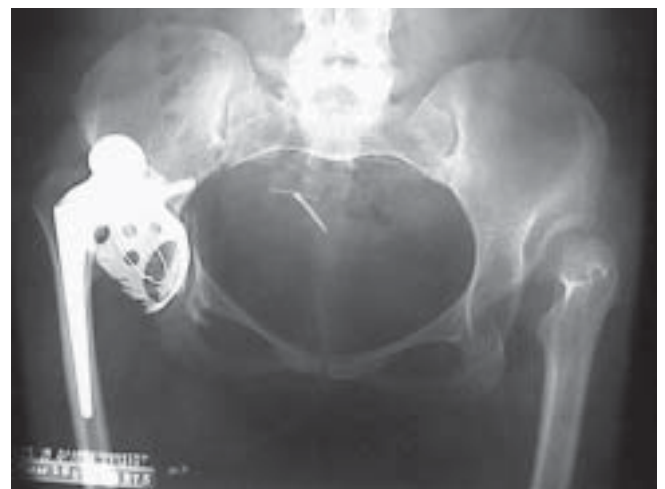
Figura 21. Control POP cadera luxada (ver muescas en anillo)

No se tuvieron casos de infección, migración ni aflojamiento de los componentes; de igual manera, no hubo luxaciones secundarias a este procedimiento. En un paciente se practicó el mismo después de una falla de artroplastia previa, en una luxación de una paciente a quien no se le hizo diafisectomía en el procedimiento inicial, presentó en la revisión neuroparaxia del ciático, que recuperó por completo al sexto mes. Las imágenes del caso, ilustran la complicación ( figura 21 ).