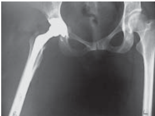
Figura 13. Control P.O.P.

con acortamiento de 54 milímetros, profundidad acetabular de 21 mm. y diámetro de canal femoral de 9 milímetros diafisectomía distal. Es llevada a cirugía realizándose Artroplastia no cementada (figura 13) mas diafisectomía supracondílea de acortamiento que consolidada rapidamente permitiéndole su marcha de manera adecuada (figura 14) a los dos meses, con apoyo parcial.