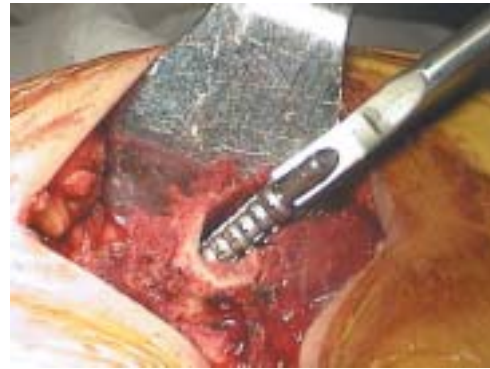
Figura 2. Fresado femoral sin cambiar anteversión

La gran ventaja de la técnica radica en realizar una artroplastia similar a la primaria, colocando el cotilo en el acetábulo original ( figura 1 ); posteriormente se trabaja el fémur en la anteversión que este se encuentre ( figura 2 ) y se coloca el vástago elegido, encontrándonos con una gran discrepancia que impide la reducción ( figura 3 ). Es por esto que se realiza un abordaje lateral supracondíleo ( figura 4 ) y la respectiva osteotomía transversa ( figura 5 ), lo que nos permite traccionar y reducir los componentes ( figura 6 ); nuevamente realizamos tracción para evaluar cuanto debemos resear en la osteotomía ( figura 7 ) y luego de realizarla, se reorienta el fémur proximal, logrando la mejor cobertura del implante y fijándolo con una placa DCP ancha ( figura 8 ), dándole compresión interfragmentaria y colocando los injertos producto del fresado en el foco de osteotomía.