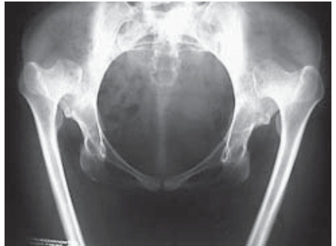
Figura 9. Rx Preoperatoria Caso 1

Paciente sexo femenino, 35 años, Luxación Congénita Alta Bilateral de Caderas, no tratada. Dolor severo, cojera y limitación funcional. Rx. preoperatoria (figura 9) muestra caderas ascendidas, poca profundidad de acetábulos originales y canal femoral de 6 mm.