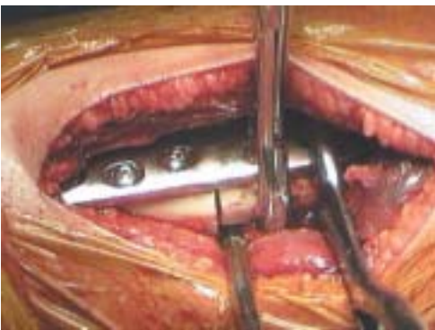
Figura 8. Osteosíntesis corrigiendo anteversión