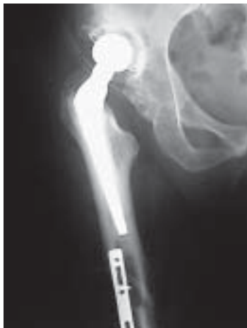
Figura 19. Control POP Centro rotacional alto

Ocho meses después sufrió trauma con desplazamiento de la copa, se practica reducción en acetábulo original ( figura 20 ).