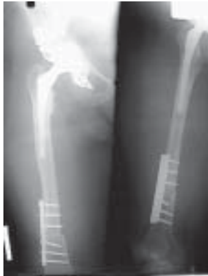
Figura 17. Control POP con anillo Bursch-Schneider

Una vez conseguido el anillo mas auto injerto, se logró el descenso y la corrección sin mayores complicaciones ( figura 17 ).