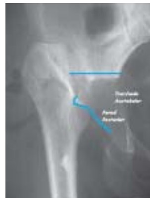
Figura 16. Acercamiento del defecto

Una vez en cirugía, al iniciar el fresado acetabular original se produjo una fractura del trasfondo acetabular (figura 16), con defecto anterior; no se contaba con anillos de refuerzo, por lo cual se suspendió el procedimiento hasta tenerlo disponible.