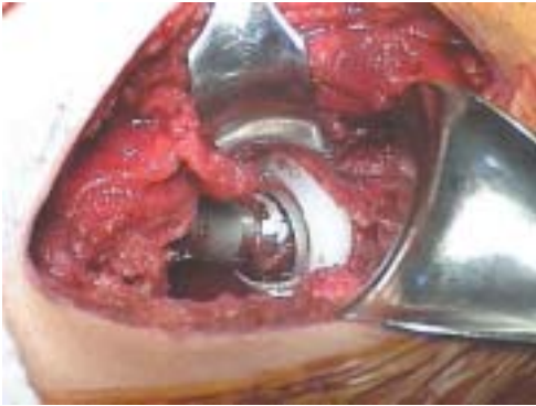
Figura 6. Reducción y corrección de anteversión