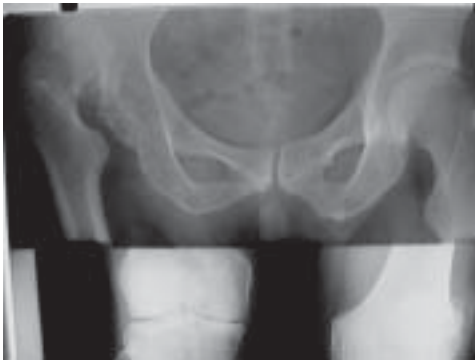
Figura 18. Test Faril preoperatorio

Paciente de sexo masculino, 62 años, dolor severo de dos años de evolución, luxación no tratada desde su infancia en un gran neoacetábulo ( figura 18 ), se programa artroplastia en centro rotacional alto, según radiografía postoperatoria ( figura 19 ).