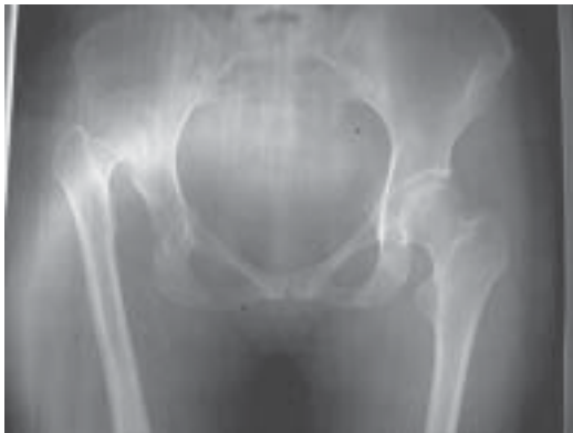
Figura 12. Control Preoperatorio

Paciente de sexo femenino, 26 años, coxalgia severa e imbalance muscular, dolor severo a la deambulacion (figura 12).