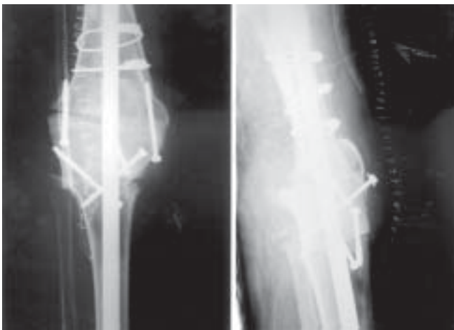
Figura 2. Radiografías de control tras realizar artrodesis de rodilla, cerclaje de fractura femoral y colocación de injerto intercalado.

Al retirar la prótesis se creó un defecto óseo de unos ocho centímetros por lo cual se indicó el aporte de injerto procedente de banco de hueso. Para ello se utilizó un fragmento de tibia proximal tallado a demanda que se intercaló sujeto con cuatro tornillos y atravesado por el clavo. La rótula también se atornilló al injerto (Figura 2).