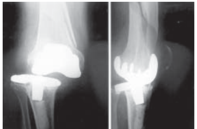
Figura 1. Radiografías anteroposterior y lateral mostrando fractura femoral periprotésica, luxación del implante y signos evidentes de aflojamiento de ambos componentes.

En las radiografías realizadas se observa fractura periprotésica de fémur derecho con luxación externa de prótesis de rodilla y signos evidentes de grave aflojamiento de ambos componentes y de rotura del polietileno ( Figura 1 ).