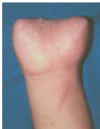
Figura 14. Amputación traumática de la mano a nivel de metacarpianos.

Caso 4. Paciente de 12 años, amputación traumática de la mano a nivel metacarpiano. Se plantearon 2 trasferencias para crear un mecanismo de pinza, Se realizó una con éxito, funcionalmente con movilidad, pero el paciente no aceptó estéticamente la transferencia y no deseó realizarse la segunda transferencia. (fig14,15)