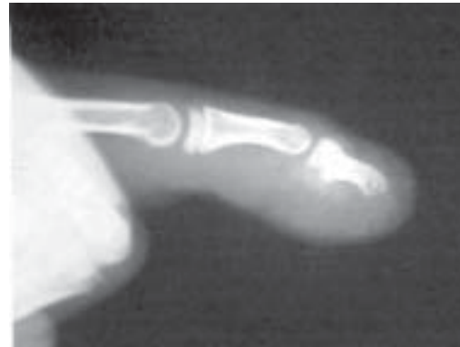
Figura 8. Resultado pos-operatorio a los 12 meses

Caso2. Niña de 5 años, amputación parcial del pulgar a nivel IF, Se realizó transposición de uña parcial del hallux, tomando piel dorsal de 0.5 cm. No complicaciones. Satisfacción por parte de los padres y de la paciente. La uña final es un poco delgada.(Fig. 9,10,11)