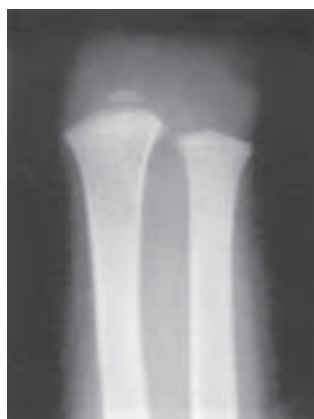
Figura 12. Amputación congénita de la mano.

Caso 3. Niño de 8 años, amputación congénita de la mano, nivel de carpo. Se realizaron 2 trasferencias en diferentes tiempos, del 2º dedo del pie, para crear un mecanismo de pinza natural. No complicaciones, Los tendones receptores se localizaron a nivel de la muñeca. El resultado estético no es muy bueno, pero le brindó un mejor apoyo al paciente para sus actividades, La movilidad al final no fue la esperada. (Fig. 12,13)