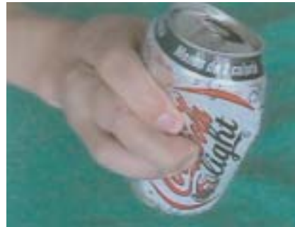
Figura 23. Amputación del 4º dedo. Transferencia del 2º dedo. Resultado final.

Caso 8. Paciente de 30 años, amputación del 3º y 4º dedo de la mano derecha producido por agente corto contundente, que además fracturó el 2º dedo. Se realizó transposición del 2º dedo del pie izquierdo para el 4º dedo de la mano. No complicaciones, Se apreció buena movilidad a nivel de la IFD, satisfacción funcional y estética del paciente y discriminación distal sensitiva de 3 mm.