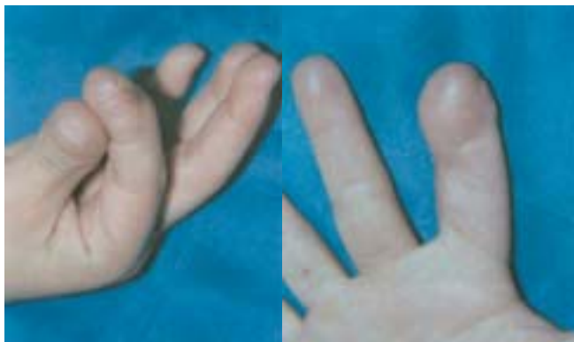
Figura 4. Amputación distal del índice.

Caso 1. Niña de 5 años, amputación parcial del índice a nivel de la IFD. Se realizó transferencia parcial de uña-pulpejo-falange del hallux. No complicaciones. Se realizó un segundo tiempo a los 6 meses para disminuir el grosor del pulpejo. Resultado bueno, aceptación estética y funcional por parte de los padres y de la paciente. Discriminación de 2 puntos a 3 mm.(Fig. 4,5,6,7,8)