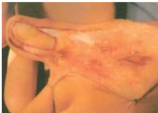
Figura 3. Detalle quirúrgico de toma parcial de la uña y de parte de pulpejo y dorso.

Dependiendo de si tomamos el segundo dedo o sólo elementos ungueales, se hacen las variaciones a la técnica respectivamente. Es importante anotar que cuando solo necesitamos el elemento ungueal del hallux se debe dejar algo de hemipulpejo tibial para asegurar el flujo arterial y unos 10 a 15 mm de piel dorsal proximal al eponiquio para preservar un buen retorno venoso (6,7) (Fig. 3)