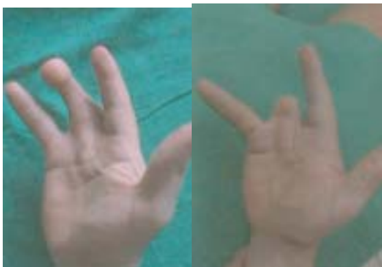
Figura 21 y 22. Amputación del 4º dedo. Transferencia del 2º dedo. Resultado final.

Caso 7. Paciente de 22 años, amputación del 3º y 4º dedo de la mano derecha secundario a herida por arma de fuego. Posteriormente infección crónica en el tercer metacarpiano que indujo a la resección del mismo. El cuarto dedo amputado a nivel de la diáfisis de la falange proximal no presentó infección. Se realizó transposición del 2º dedo del pie derecho sin complicaciones, tomándolo a nivel de la articulación metatarsofalángica. La movilidad final de la IFD fue buena y gran aceptación estética y funcional por parte del paciente. Discriminación sensitiva a 3 mm distal (Fig. 21,22,23)