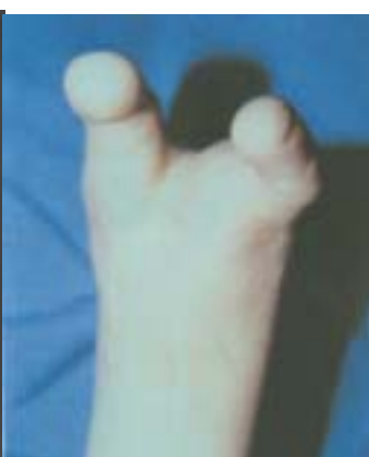
Figura 13. Resultado pos-operatorio después de haber transferido en 2 tiempos, el 2º dedo del pie.

Caso 4. Paciente de 12 años, amputación traumática de la mano a nivel metacarpiano. Se plantearon 2 trasferencias para crear un mecanismo de pinza, Se realizó una con éxito, funcionalmente con movilidad, pero el paciente no aceptó estéticamente la transferencia y no deseó realizarse la segunda transferencia. (fig14,15)