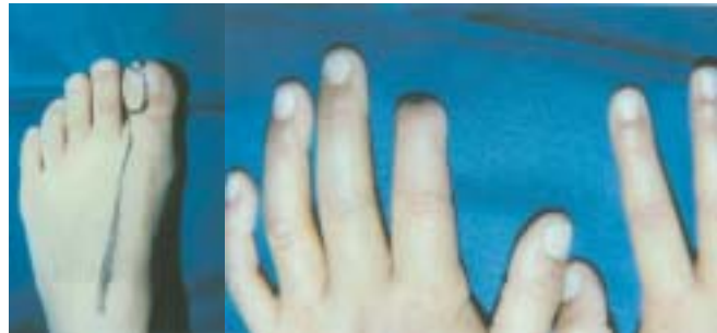
Figura 6 y 7. Resultado pos-operatorio a los 12 meses