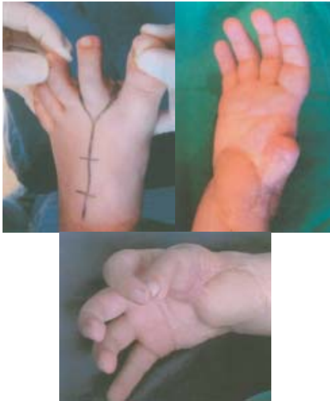
Figura 18, 19 y 20. Amputación del pulgar con arma de fuego. Toma del 2º dedo y resultado final.

Caso 7. Paciente de 22 años, amputación del 3º y 4º dedo de la mano derecha secundario a herida por arma de fuego. Posteriormente infección crónica en el tercer metacarpiano que indujo a la resección del mismo. El cuarto dedo amputado a nivel de la diáfisis de la falange proximal no presentó infección. Se realizó transposición del 2º dedo del pie derecho sin complicaciones, tomándolo a nivel de la articulación metatarsofalángica. La movilidad final de la IFD fue buena y gran aceptación estética y funcional por parte del paciente. Discriminación sensitiva a 3 mm distal (Fig. 21,22,23)