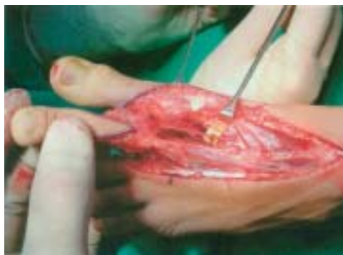
Figura 1. Red venosa del dorso del pie.