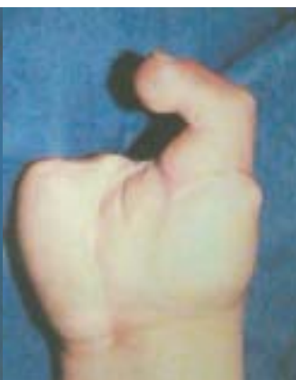
Figura 15. Resultado después de haber transferido el 2º dedo del pie.

Caso 5. Paciente de 8 años, que 3 años antes recibió amputación del pulgar derecho a nivel de la articulación