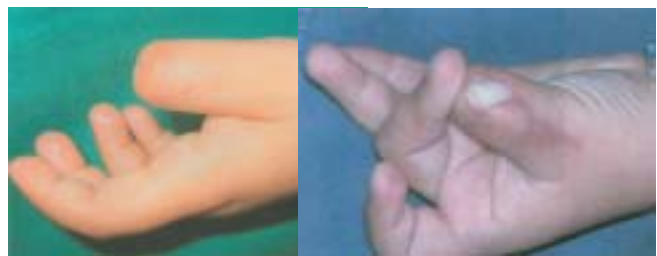
Figura 10 y 11. Resultado pos-operatorio 8 meses después de la transferencia parcial de la uña del hallux.