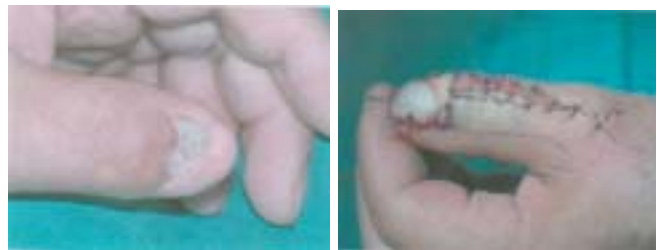
Figura 24 y 25. Transposición parcial de la uña del hallux para reconstruir una lesión severa de la uña del pulgar.

Caso 10. Paciente de 45 años con lesión grave del lecho ungueal del pulgar, que ocasiona dolor. El paciente se somete a una transferencia parcial de la uña del hallux. Particularmente en este caso el paciente no presentaba arteria metatarsiana dorsal, lo que obligó a utilizar la arteria plantar lateral. Durante el acto operatorio se notó la perfusión lenta, pero aparentemente suficiente. De otra parte el flujo por la anastomosis era muy bueno. Al segundo día se notó mayor lentitud de la perfusión que obligó a una revisión, notando igualmente que la anastomosis se encontraba con buen flujo, pero la perfusión no mejoró, perdiéndose el colgajo finalmente. (Fig. 24,25,26,27)