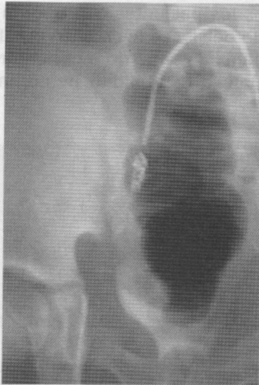
Figura No.1 11 Años Múltiples sitios de sangrado en colaterales de arteria hipogástrica (extravasación medio de contraste).