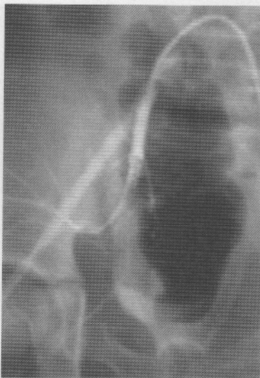
Figura No.2 11 Años espiral de Gianturco para embolización selectiva de arteria hipogástrica.

Los objetivos principales de la emboloterapia en trauma son: 12,13