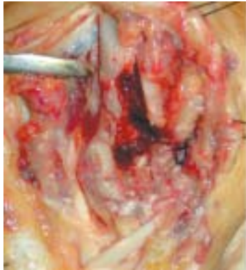
Figura 1a. Lavado quirúrgico, desbridamiento