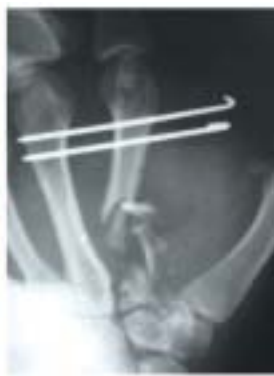
Figura 1b. Estabilización transitoria con agujas de kirschner