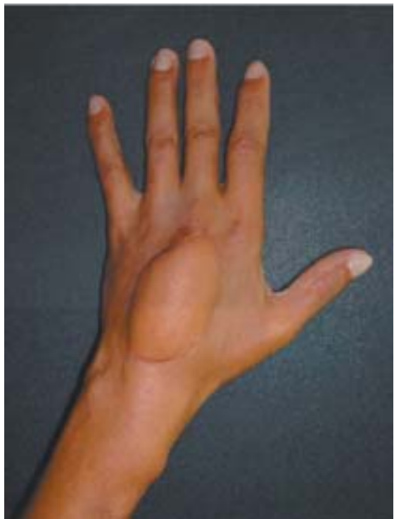
Figura 10. Postoperatorio y cubrimiento cutáneo con colgajo