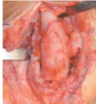
Figura 5. Colocación del injerto.