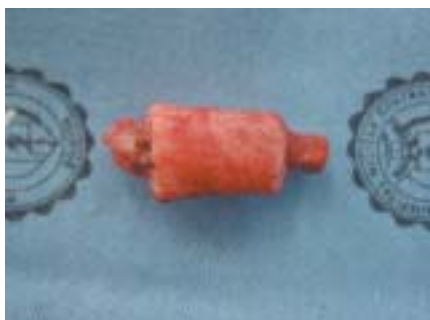
Figura 4. Preparación de extremos de Injerto