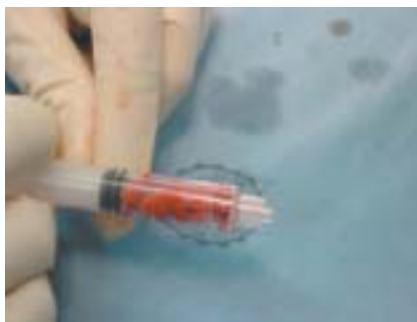
Figura 2. Preparación injerto