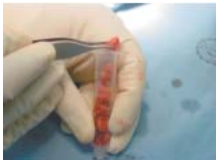
Figura 3. Injerto esponjosa