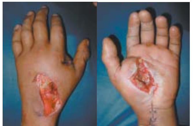
Figura 8. Cubrimiento cutáneo vista dorsal